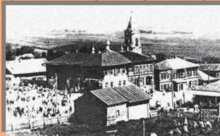
Молвитино. Центральная площадь. Фото. 1930 гг.

В основу композиции герба и флага положен подвиг русского крестьянина Ивана Сусанина, в честь которого назван районный центр - Сусанино и район.